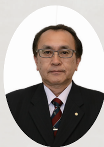
奈井江町議会議長