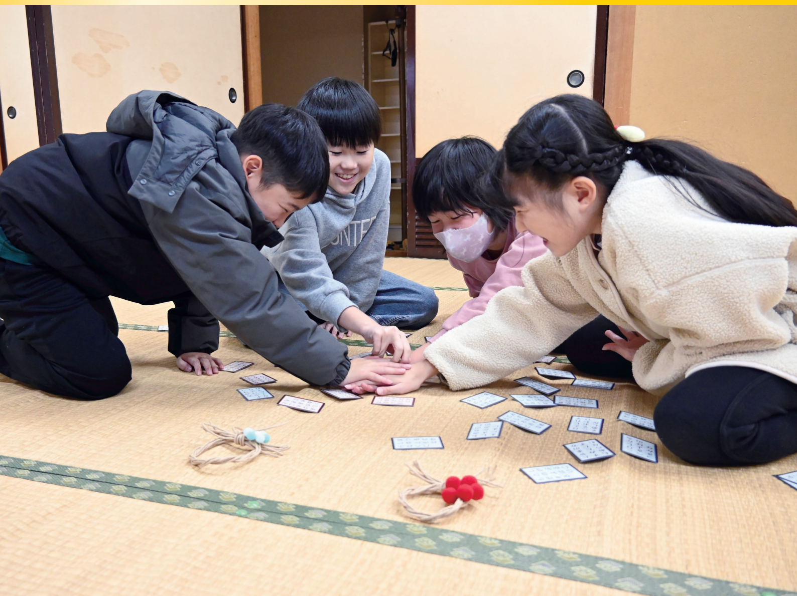
読み札が響く、新年のはじまり