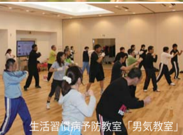
生活習慣病予防教室「男気教室」

駅前にある文化ホールは、246 席を備える室内楽専用の音楽ホールです。音楽を愛する町民に支えられているこのホールには、多くのトップレベルの演奏家が訪れています。そして、「このホールの響きの美しさは、国内にとどまらず世界でも屈指のもの」という評価を受けています。