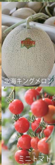
北海キングメロン