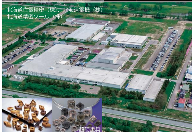
北海道住電精密 (株)、北海道電機 (株) 北海道精密ツール (株)