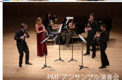
PMF アンサンブル演奏会