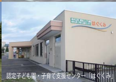
認定子ども園・子育て支援センター「はぐくみ」