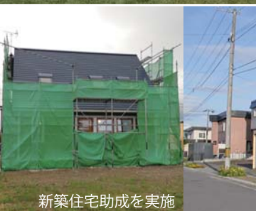
新築住宅助成を実施