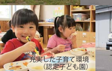
充実した子育て環境 (認定子ども園)