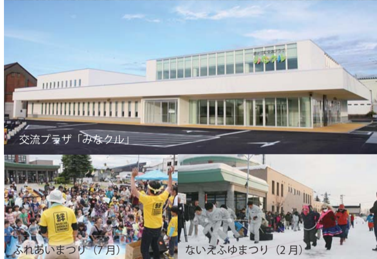
交流プラザ「みなクル」