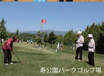
寿公園パークゴルフ場