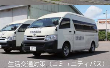
生活交通対策 (コミュニティバス)