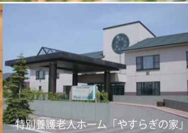
特別養護老人ホーム「やすらぎの家」