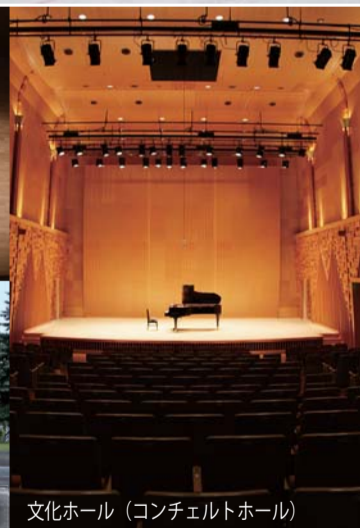
文化ホール (コンチェルトホール)