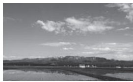
水が張られた田んぼに写る山並み

しかし、東京で働いていたときは寒いくらいのオフィスに一日中いたり、外を歩いてもビルの中やショッピング施設の中を通り抜けたり、徒歩5分前後にはコンビニやスーパー、本屋などちょっと休憩できる場所がいっぱいあって常に涼しいところに逃げ込んでいたので基本的には暑さに慣れていません(笑)