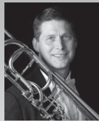
デントン・ホール・ポラート (tb) メトロポリタン歌劇場管弦楽団