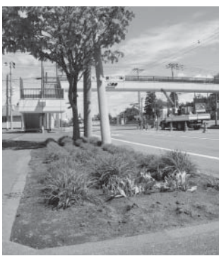
国道沿いの植樹柵

また、国道を管理する岩見沢道路事務所と協議を行った結果、今後は、道路管理者にて植樹柵の草刈りを行うと回答を得ました。街路樹を切ることはできませんが、落ち葉の処理に際しても通行に支障をきたす