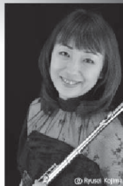
ホルン 西松 純子 東京交響楽団首席奏者 フジエコーンコンプレックス