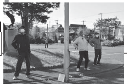
朝日を浴びながら 皆と一緒にラジオ体操