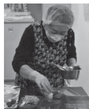
猪卷さんが、インタビューのお相手をしている間も他のメンバーは手際よく、サロンの準備を進めます。

活動を始めてみて、歩いて行ける範囲にこの様な場は必要だなと思いました。家に閉じこもっていると声を出すこともなく、私自身も、この場に来て話を聞いてもらっただけで気持ちが楽になります。