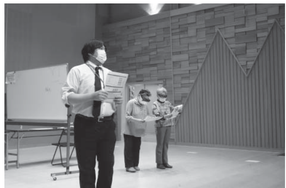
生活支援コーディネーターは、地域で交流の場やボランティアを担う人材を育成しています。