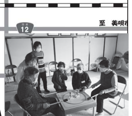
レクリエーションに夢中