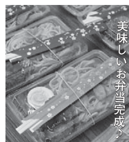
ナポリタン、ハンバーグ、ゆでたまご