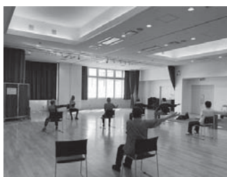
〈シルバー元気塾の様子〉