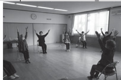
若々しく体を動かす！

サロンへの参加や具体的な日時に関する問い合わせ 奈井江町社会福祉協議会 (文化ホール内)