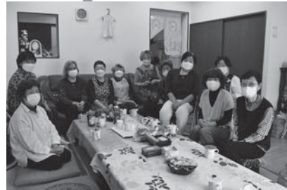
楽しくおしゃべり