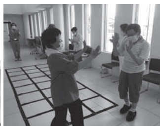
〈ふまねっとの集いの様子〉