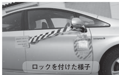
ロックを付けた様子