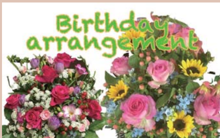
いしかわ生花店 「パースデアレンジメントフラワー」