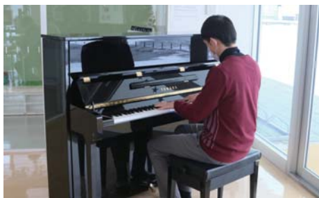
12月からみなクルに設置されたストリートピアノ。多くの方が弾いてくれます。

この広報紙が読まれている頃には、公共施設に置いてあります。ご自由にお持ちいただいで結構です。限定生産ですので、なくなり次第終了となります。是非、お家に飾っていただければ嬉しく思います。