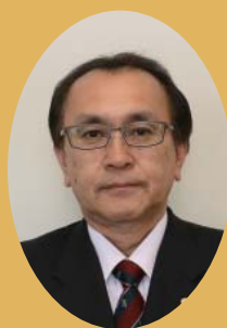
奈井江町議会議長